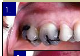
Aplikácia výplne systémom Cerec ®: (1) Pred, (2) Po zákroku

s využitím počítačového programu Cerec 3D. O niekoľko minút po schválení dizajnu vašim zubárom sú dáta tvaru vášho zubu a obnoviteľnej časti zaslané do separátneho frézovacieho prístroja. Keramický blok, ktorý má rovnaký farebný odtieň ako váš zub je vložený do tohto prístroja a o 10 - 20 minút je výplň pripravená tak, aby správne prilhla na daný zub. Nakoniec stomatológ prekontroluje správne osadenie a skus. Výplň je potom detailnejšie povrchovo upravená. A tak máte jednoducho a pri jedinej návšteve zub plne a kvalitne zrekonštruovaný.