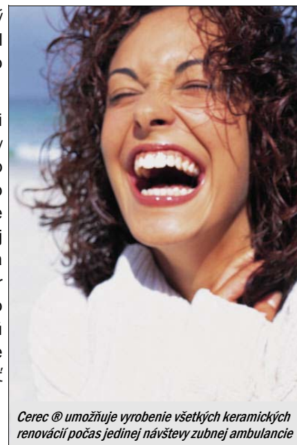
Cerec ® umožňuje vyrobienie všetkých keramických renovácií počas jedinej návštevy zubnej ambulancie

Tieto materiály sú veľmi príbuzné zloženiu štruktúry vášho vlastného zubu. To znamená, že ak jete niečo teplé a potom pijete chladný nápoj váš zub aj s keramickou výplňou sa rozťahujú a sťahujú takmer rovnakou rýchlosťou. Tieto materiály chemicky prilnú k vášmu zubu, čo umožňuje stomatológovi zachovať viac tkaniva zdravého zubu.